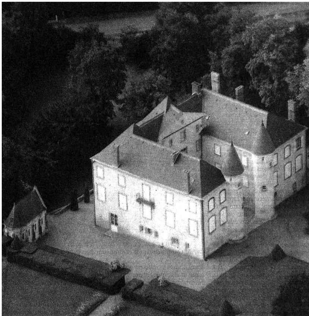
À l'entrée du village, la demeure de Valéry Giscard d'Estaing compte 1 200 mètres carrés sur une propriété de 13 hectares, traversée par un petit cours d'eau.

se se sont manifestés. Mais pour l'instant aucune offre sérieuse n'a été déposée. Certes, le marché n'est guère porteur et un château du type de La Varvasse ne se vend pas comme un studio parisien.